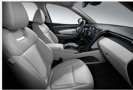
Gray belső (Bőr kárpitozás esetén) szövet kárpit esetén az ülések feketék