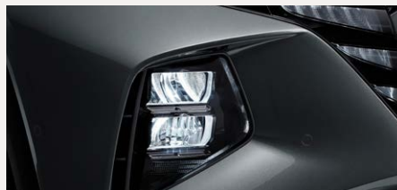
LED MFR fényszórók és rejtett DRL