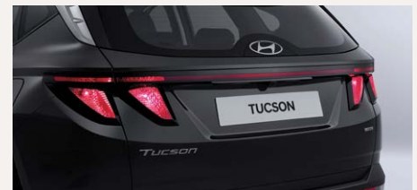
Sztenderd hátsó lámpa