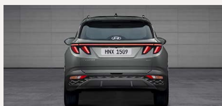
LED-es hátsó lámpák