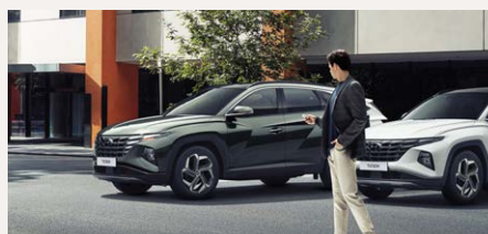
Távírányításos beparkoló rendszer