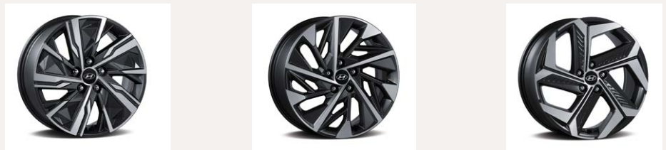
Keréktárcsa választék, balról jobbra: 17" alu - 18" alu - 19" alu