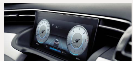
10,25" Supervision műszeregység