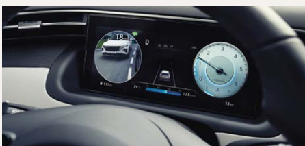
Holtterfigyelő monitor (BVM)