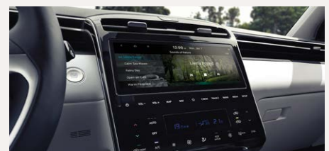
10,25" Navigációs rendszer