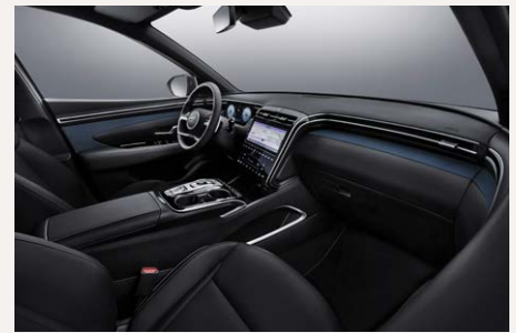
Teal belső (Comforttól)