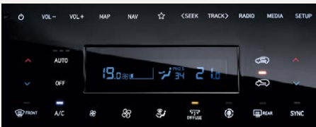
Kétfónás automata légkondicionáló